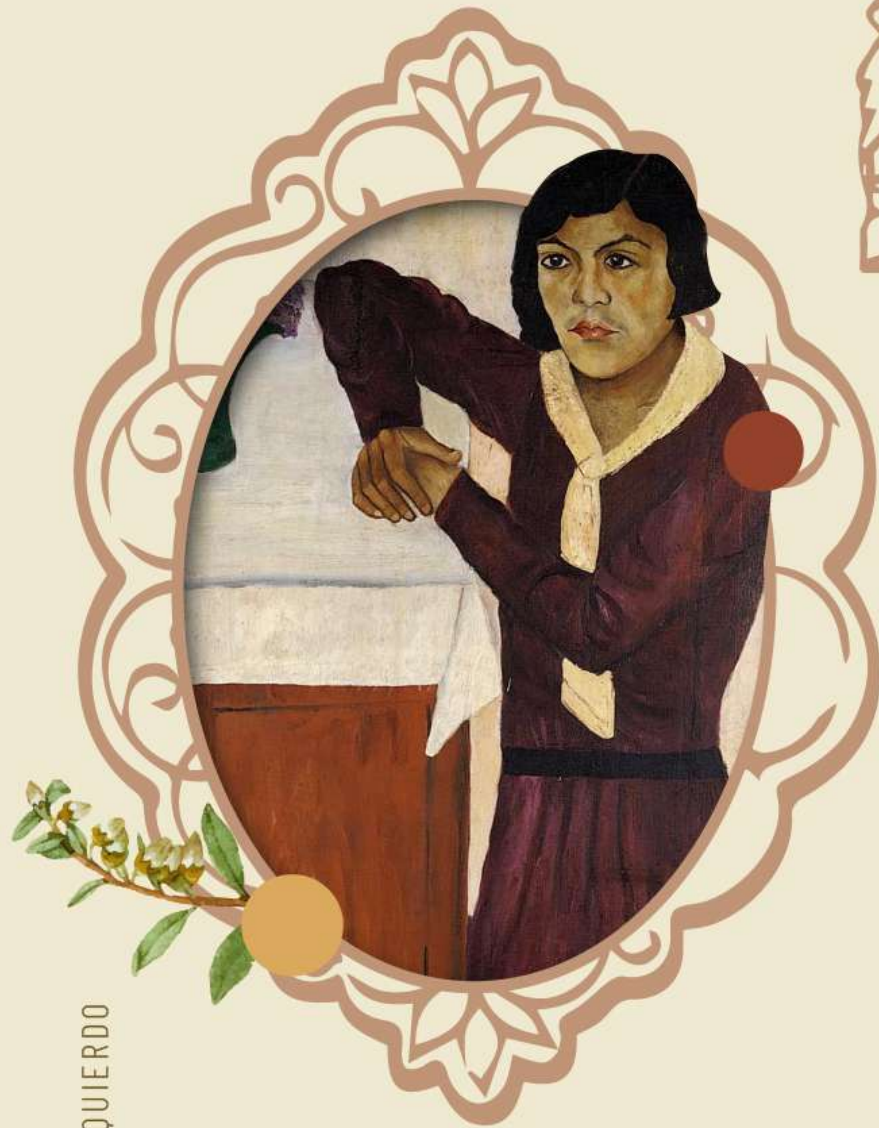
El retrato de Belém

En sus obras muestra reiteradamente la figura femenina en diversos escenarios.