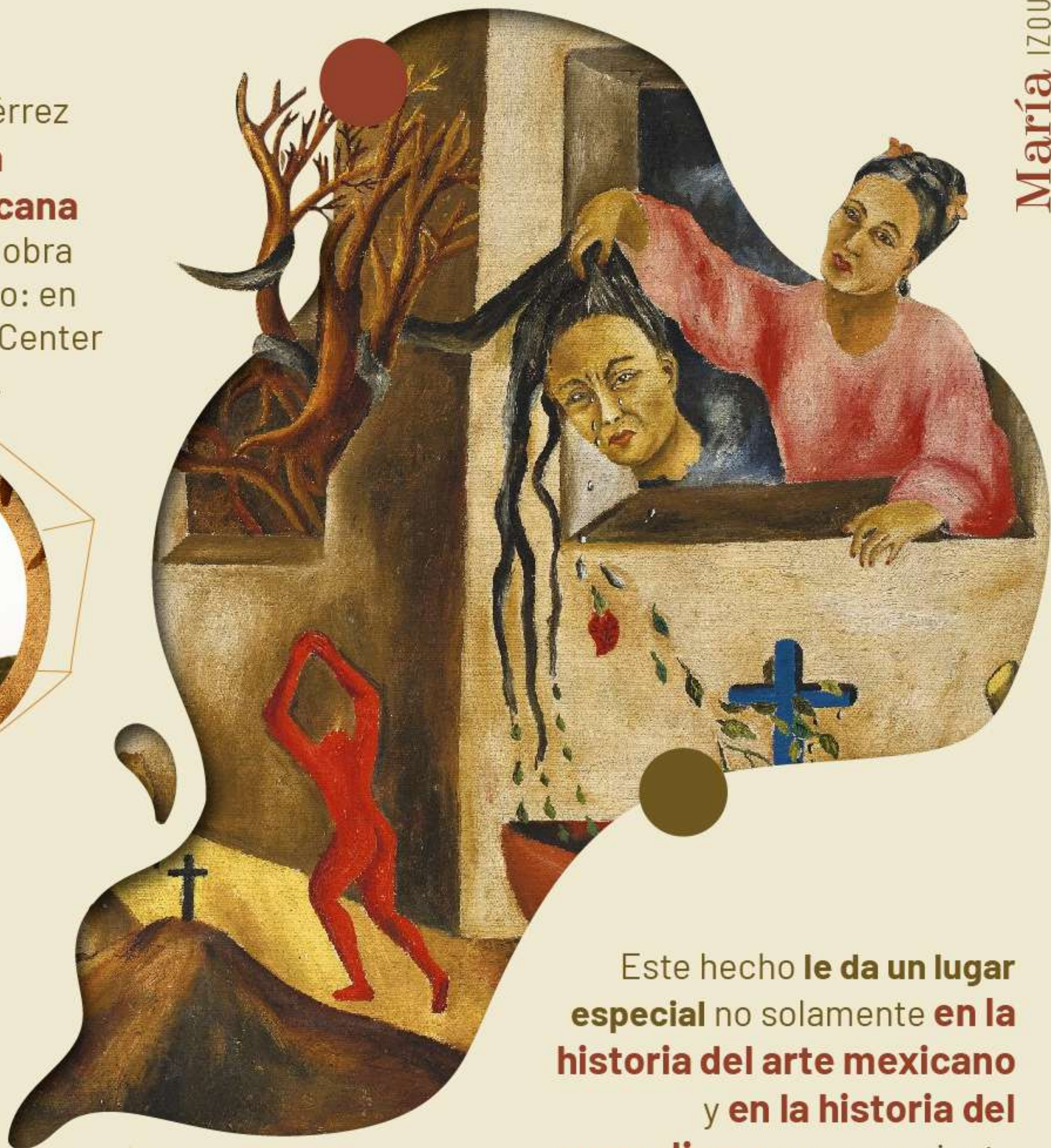
Guano y Presentimiento, 1947

Este hecho le da un lugar especial no solamente en la historia del arte mexicano y en la historia del surrealismo como corriente artística, sino en la historia del feminismo en México.