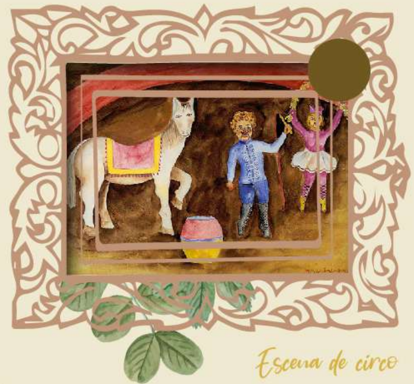
Escena de circo

Izquierdo formó parte de la Liga de Escritores y Artistas Revolucionarios.